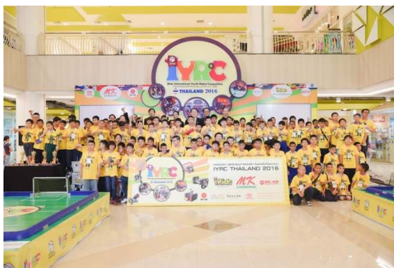
IYRC THAILAND 2016