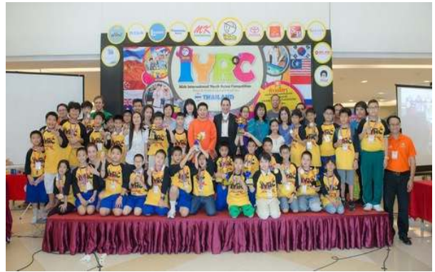
IYRC THAILAND 2015