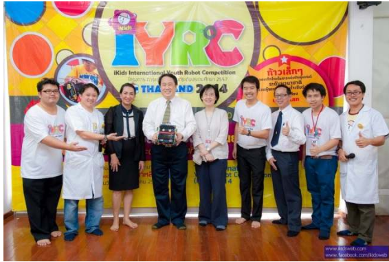
IYRC THAILAND 2014